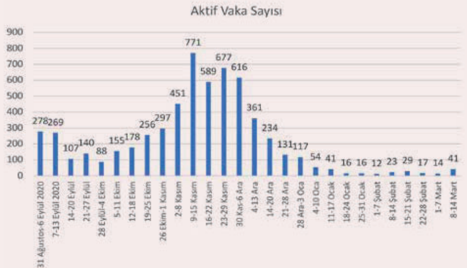
Grafik 2- Birleşik Metal İş Sendikası'nın Örgütlü Olduğu İşyerlerinde Haftalık Görülen Vaka Sayısı

Metal sektörü Türkiye açısından belirgin bir biçimde işçi eylemlerinin yoğunlaştığı bir sektör dür. Sendikal işçiler örgütlü eylemleri ile yüksek ücret artışları elde etmiş, COVID 19 sürecinde Türkiye'de iş sağlığı ve güvenliği alanında pek kullanılmayan "işten kaçınma hakkını" kullanabilmiştir. Sektörde örgütlü olan Birleşik Metal İşçileri Sendikası, Türkiye'de pek çok sendikal hakkın kullanılmasında yaptığı öncülükle köklü bir mücadele geçmişine sahiptir. Bu anlamda sendika üyelerinin üzerinden yapılan bu değerlendirmeler, görece korunaklı bir işçi kesimini temsil etmektedir. Küçük işletmelerin ve güvencesizliğin yaygın, örgütsüzlüğün hakim olduğu sektörlerde bu tablonun çok daha ağır olduğu muhakkaktır. Haziran ayında yine BİSAM tarafından Taşımacılık sektörü ile metal sektörünü karşılaştıran bir başka anket çalışması yapılmıştır. İki sektör arasında COVID 19'a yakalanma oranları açısından anlamlı bir fark oluşturulduğu görülmektedir. Taşımacılık sektöründeki işçiler arasında COVID 19 tanısı alanların oranı % 5,8 ile metal sektöründeki işçiler arasında COVID 19 tanısı alanların oranı %2,8'dir. İki sektör arasında COVID 19 tanısı açısından anlamlı bir fark tespit edilmiştir. Sektörler arasında alınan tedbirler kadar yapısal bulunmaktadır.